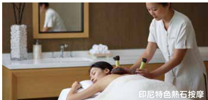
印尼特色熱石按摩

(可代安排團友自費參加QUICK SILVER海上遊或自費享受印尼特色熱石按摩)