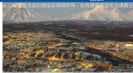
彼得羅巴甫洛夫斯克