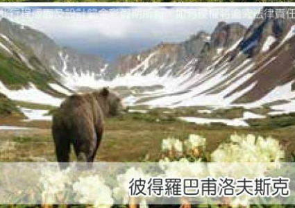
彼得羅巴甫洛夫斯克