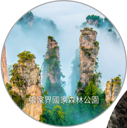
張家界國家森林公園