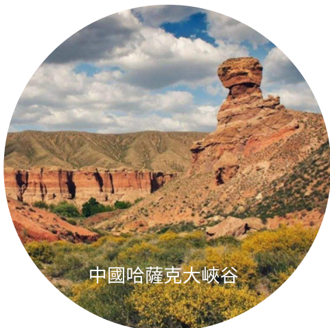
中國哈薩克大峽谷