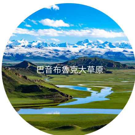
巴音布魯克大草原