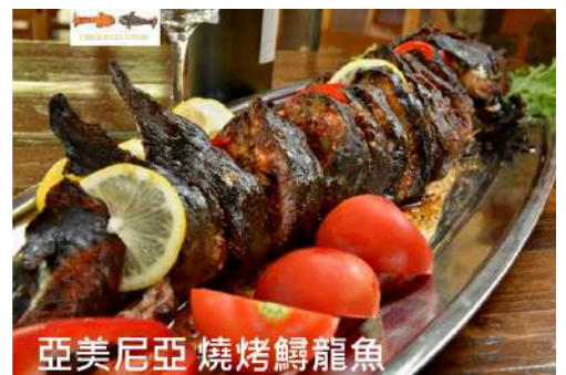
亞美尼亞 燒烤鱈龍魚