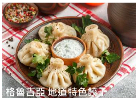
格魯吉亞 地道特色餃子