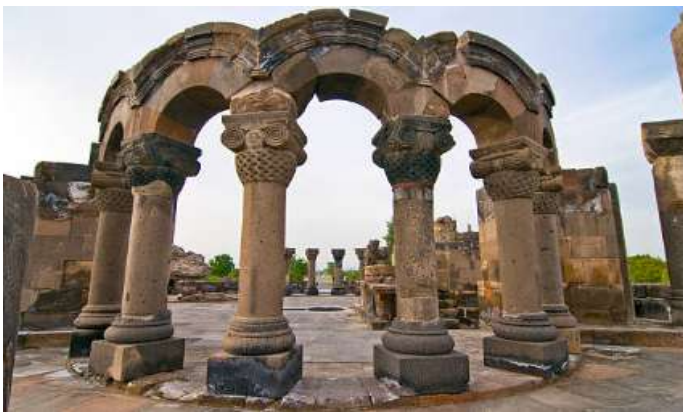
茲瓦爾特諾茨 ：又名「天使之堂」始建於7世紀，為一中央圓頂建築，20世紀初重新被發掘。