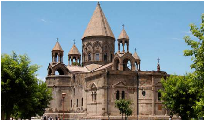
埃奇米阿津 ：亞美尼亞在公元301年視基督教為國教。埃奇米阿津主教堂為亞美尼亞第一所教堂。被稱為「亞美尼亞梵蒂岡」。