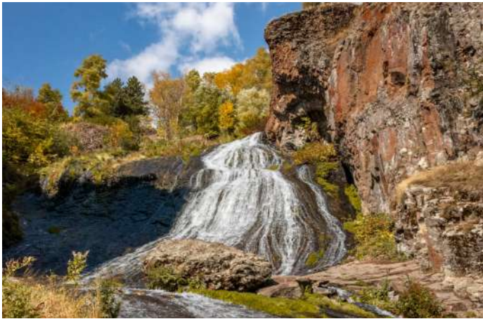
傑爾穆克瀑布 ：是亞美尼亞的第二大瀑布，它高達 72 米，流入阿爾帕河。因其流水細而長，宛如少女的秀髮。故又名“美人魚頭髮瀑布”。