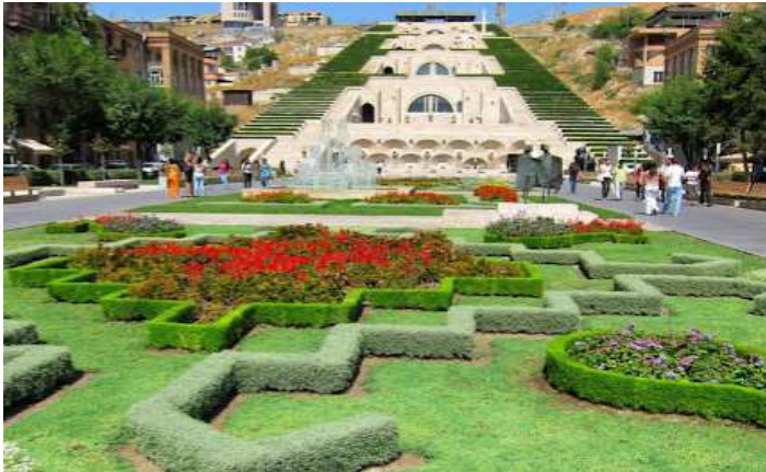
市中心瀑布廣場(戶外藝術展覽品) 早餐：酒店 午餐：當地餐館 晚餐：酒店 住宿：Marriott 或 Radisson Blu 或同級